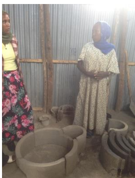
Brandstof besparende kachel